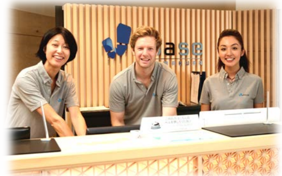
フロントではバイリンガルなスタッフが迎え。中央はロッキー支配人 http://we-base.jp/kamakura/room.html