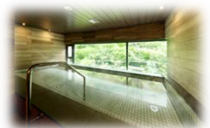
右：自由に使えるバスルーム