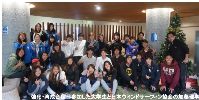
強化・育成合宿へ参加した大学生と日本ウインドサーフィン協会の加藤理事

http://we-base.jp/kamakura/index.html (ホームページ) https://www.facebook.com/webasekamakura/ (Facebook) https://www.instagram.com/webasehostel/ (インスタグラム)